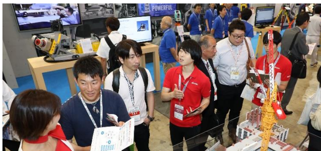
出展ブースでは活発な商談が行われています