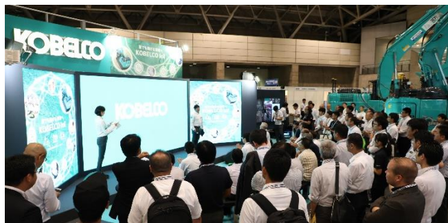
出展ブースでのセミナーも大盛況

会期：2018年8月28日(火)～30日(木) 会場：幕張メッセ (展示ホール1・2 屋外展示ホール(デモンストレーション)) 主催：建設・測量生産性向上展 実行委員会 後援：国土交通省 協力：(一社)日本建設業連合会 / (一社)全国建設業協会 (一社)全国中小建設業協会 / (一社)日本建設機械施工協会 (公財)日本測量調査技術協会 / (公社)日本測量協会 (一社)日本測量機器工業会 / (一社)全国測量設計業協会連合会 (一社)建設コンサルタンツ協会 / (一社)日本橋梁建設協会 (一社)日本道路建設業協会 / (一社)プレストレスト・コンクリート建設業協会 協力展示会：ハイウェイテクノフェア (公益財団法人 高速道路調査会)