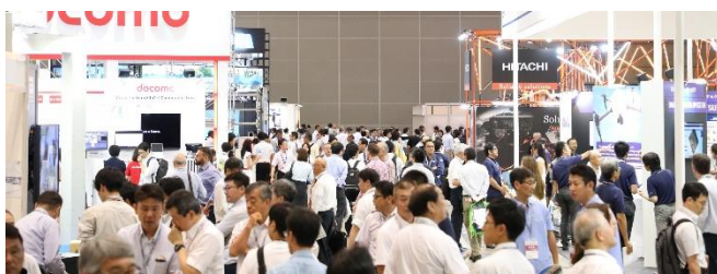
多くの来場者で会場は熱気に包まれました