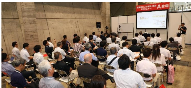
出展社による製品・技術PRセミナーも大盛況