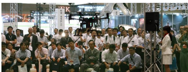
ドローンデモンストレーションも大盛況

最終日30日は16時まで！ぜひ、ご来場ください！！ 事前登録は公式HPから⇒ http://cspi-expo.com/