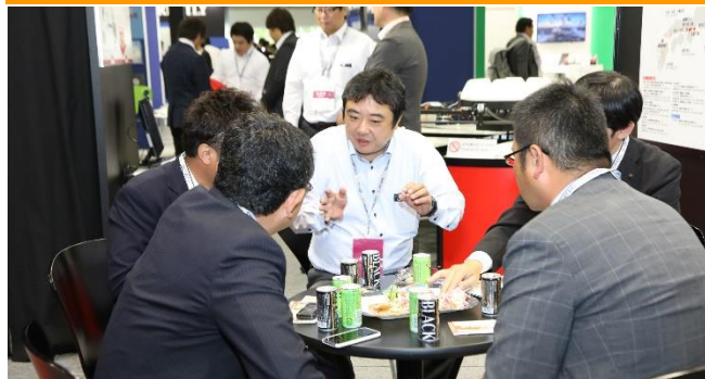
出展社と来場者で活発に商談が行われています

24日(金)まで開催！最終日24日は16時まで 事前登録は公式HPから⇒ http://cspi-expo.com/