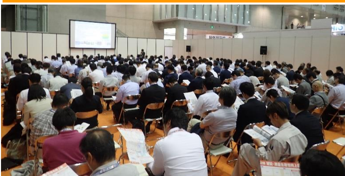
特別セミナーも大盛況