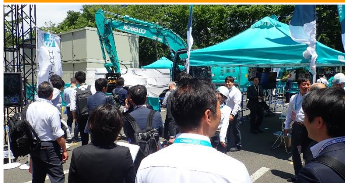
屋外展示場ではデモンストレーションを実施