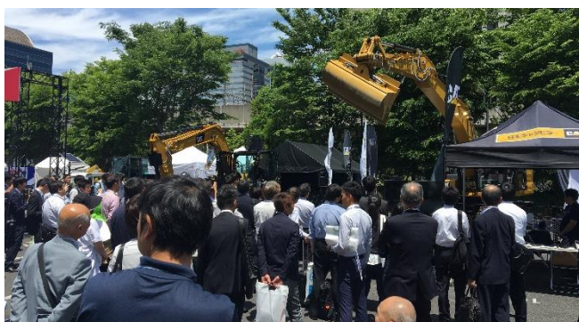
屋外展示場も多くの来場者で大盛況