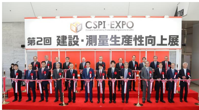
業界著名人24名によるオープニングセレモニー

会 期：2019年5月22日(水)～24日(金) 会 場：幕張メッセ 展示ホール9・10・11 屋外展示場(デモンストレーション)