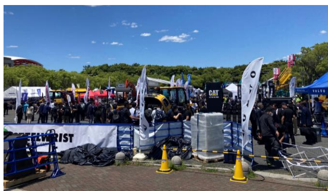
屋外展示場でデモンストレーションを実施

本日24日(水)～26日(金)まで開催！初日からご来場ください！！ 来場事前登録(無料)は公式HPから ➡ http://cspi-expo.com/