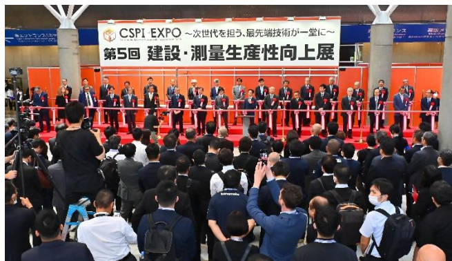
業界著名人33名によるオープニングセレモニー

会場：幕張メッセ 展示ホール1・2・3・4・5、屋外展示場【展示面積 約40,000㎡】