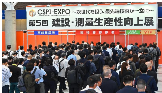
会期初日から多くの業界関係者が来場