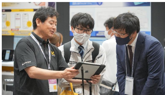
出展ブースでは活発な商談が行われております