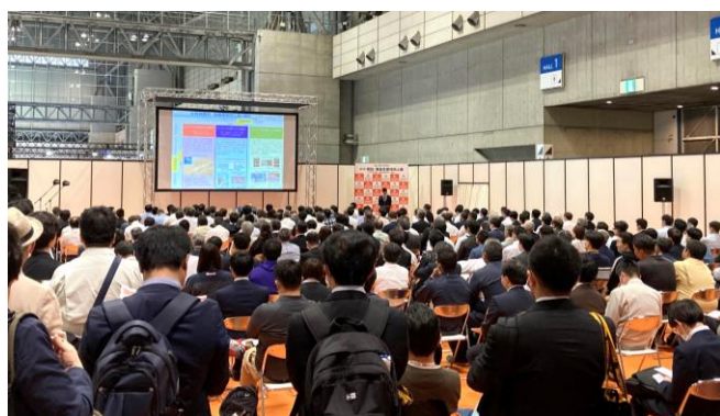
特別セミナーも多くの方が聴講しています