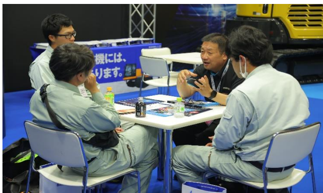
出展ブースでは活発な商談が行われております