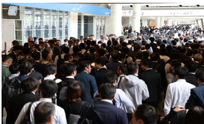
会期初日から多くの業界関係者が来場