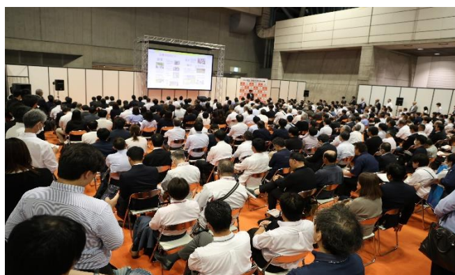
特別セミナーも多くの方が聴講しています