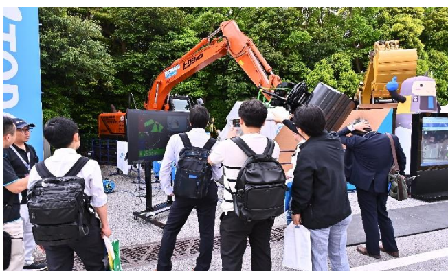
屋外展示場でデモンストレーションを実施

本日22日(水)～24日(金)まで開催！初日からご来場ください！！ 来場事前登録(無料)は公式HPから ➡ https://cspi-expo.com/