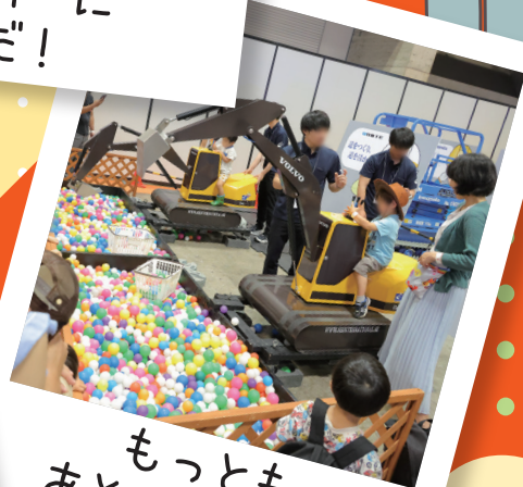
もっともっと、 あそびたかった!