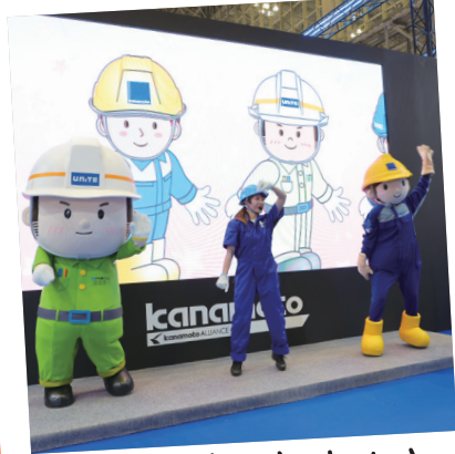
おにんぎょうさんと あくしゅしたよ!