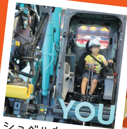
ショベルカーに のれたんだ!