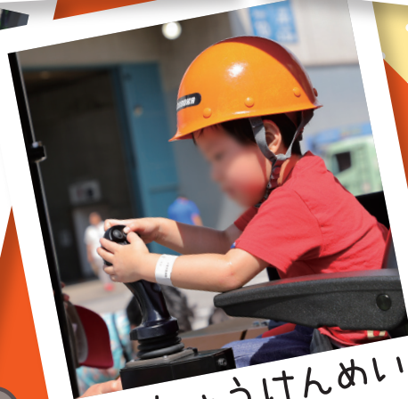
いっしょうけんめい がんばったよ!