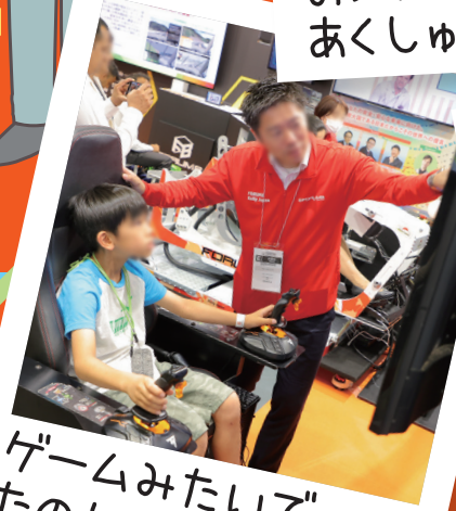
ゲームみたいで たのしかった!